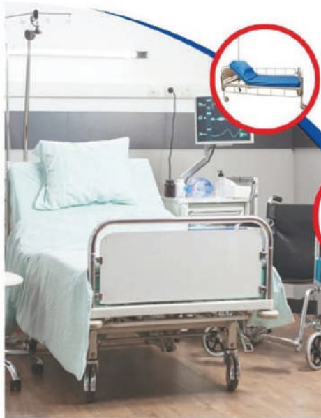
Hospital Bed / Mattress